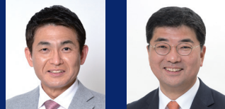
八王子市長 八王子市長 伊藤しやけ 和夫 都議会議員 伊藤しょうこう