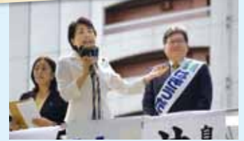
有村治子参議院議員 応援