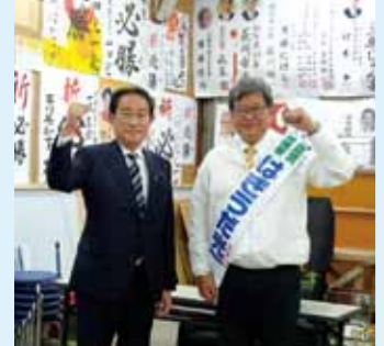
岸田文雄前総理 応援