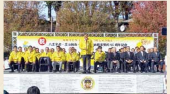
第45回 八王子いちよう祭り