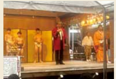
子安神社 立き相撲