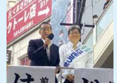
松井一郎前大阪市長 応援