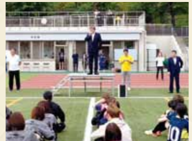
2024 Ko-1 Cupフットサル大会