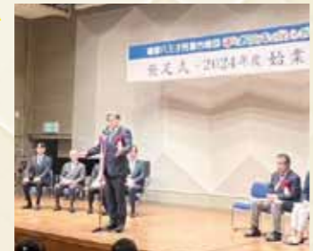
はちおうじキッズシンガーズ発足式