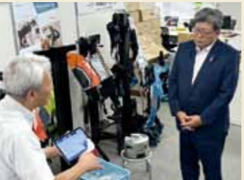
GX推進モデル都市へ