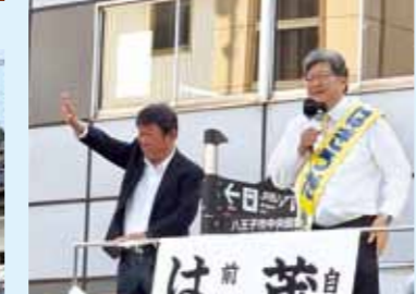
茂木敏充前幹事長 応援