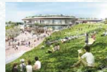
【集いの拠点】整備事業イメージ図

併せて、もう1つの矯正施設、婦人補導院(中野町)の公有化に向け、市と国との協議を加速します。中野市民センター・甲の原体育館に隣接する約1.5haの土地を一体的に活用する事で、市民の皆様の利便性を上げる事ができると確信します。