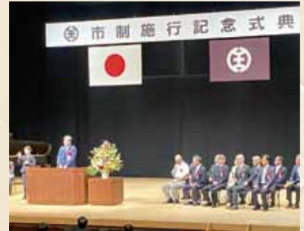
令和6年度 市制施行記念式典