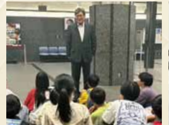
地元小学校の国会見学