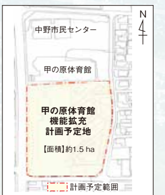
【中野町婦人補導院跡地】整備計画図