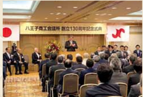
八王子商工会議所 創立130周年記念式典