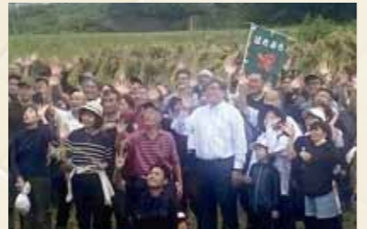
はちぶらの稲刈り体験イベント